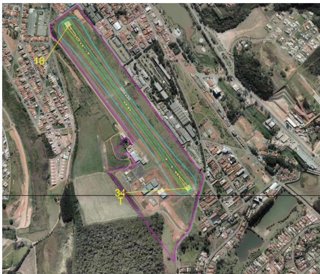
Figura 3 – Curvas de Ruído – Movimento registrado em 2018.

O plano é um instrumento que possibilita a harmonia entre as operações aeroportuárias e o desenvolvimento urbano. Ainda não foram registradas alterações em procedimentos operacionais ou rotas de decolagem e aproximação, visando a diminuição do impacto sonoro sobre as áreas circunvizinhas.