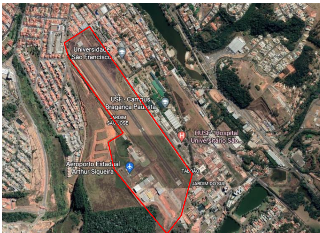
Figura 1 – Aeroporto e Região Circunvizinha.

A área circunvizinha ao aeroporto está classificada como Zona de Desenvolvimento Urbano – ZDU 1 no Plano Diretor Municipal, aprovado pela Lei Municipal nº 893/2020. De acordo com o Art. 208 da referida Lei, as Zonas de Desenvolvimento Urbano - ZDU correspondem às porções do território inseridas no perímetro urbano, pertencente à Macrozona Urbana, propícias para abrigar os usos e atividades urbanos de diversos tipos, caracterizando-se como as áreas destinadas à expansão da área urbanizada, ou seja, a ZDU permite o desenvolvimento imobiliário residencial, comercial e de uso misto sem distinções por regiões ou bairros.