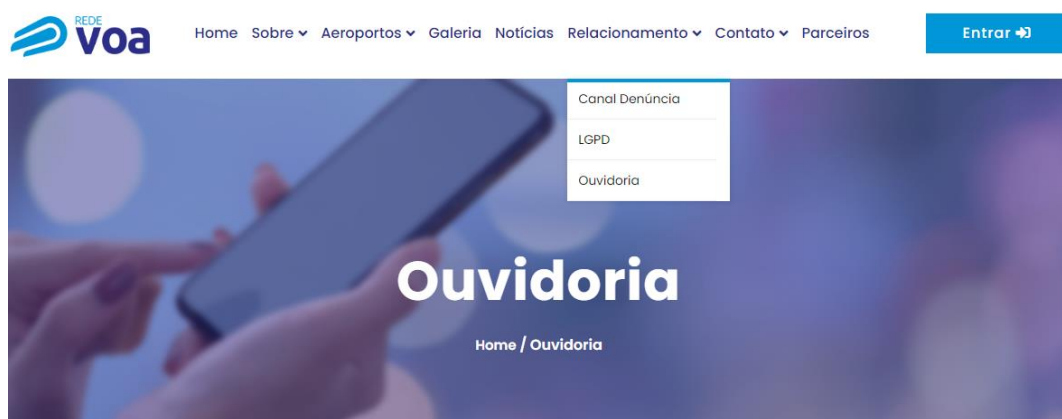
Figura 4 – Imagem do sítio eletrônico da Rede Voa.

A Voa SP, por meio de seu sítio eletrônico, dispõe de um Canal de Ouvidoria, o qual podem ser realizadas reclamações e comunicações. O Coordenador Aeroportuário Local também mantém um diálogo aberto junto à comunidade circunvizinha.